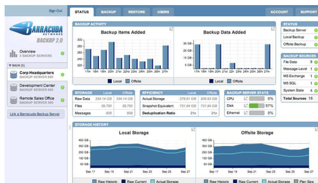
La Interfaz Web de Barracuda Backup Service brinda acceso y muestra el uso de la información respaldada, además que permite la restauración rápida de archivos.

Diseñado para organizaciones de varios tamaños y de diferentes necesidades, el Barracuda Backup Server mantiene una copia local de los datos y los transfiere eficientemente offsite sin colocar carga adicional en los servidores en producción. El almacenamiento Offsite cloud en Barracuda Networks esta monitoreado y manejado por Barracuda Central como parte de Barracuda Backup Suscription mensual. Para las ocasiones en que todos los datos no son igualmente críticos para el negocio, el Barracuda Backup Service permite seleccionar de manera fácil solamente la información más crítica para ser almacenada offsite para protección por desastre. El Barracuda Backup Service incluye soporte técnico y asistencia de emergencia con restauraciones en caso de un fallo o desastre del sistema.